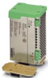
Adapter for mounting QUINT-POWER power supply units, 1 A, 2.5 A, and 5 A, at a 90° angle to the DIN rail

Please be informed that the data shown in this PDF Document is generated from our Online Catalog. Please find the complete data in the user's documentation. Our General Terms of Use for Downloads are valid ( http://phoenixcontact.com/download )