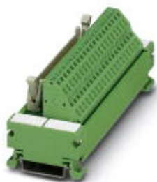
VARIOFACE COMPACT LINE, interface module for 32 channels, with LED, for assembly on DIN rail NS 35/7.5, spring-cage connection

Please be informed that the data shown in this PDF Document is generated from our Online Catalog. Please find the complete data in the user's documentation. Our General Terms of Use for Downloads are valid ( http://phoenixcontact.com/download )