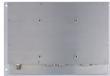
▲ Rear view