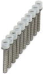
Jumper, Number of positions: 10, Color: silver

Please be informed that the data shown in this PDF Document is generated from our Online Catalog. Please find the complete data in the user's documentation. Our General Terms of Use for Downloads are valid ( http://phoenixcontact.com/download )