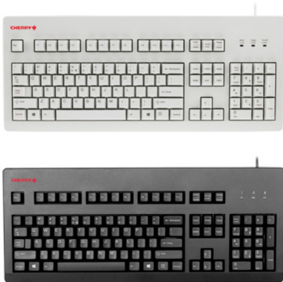
Models may vary from the image shown