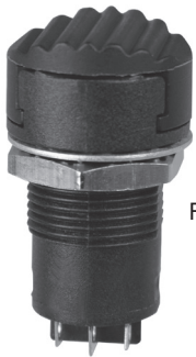
Flush Button Style