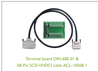
Terminal board DIN-68S-01 & 68-Pin SCSI-VHDCI cable ACL-10568-1

* For more information on mating cables, please refer to P2-61/62.