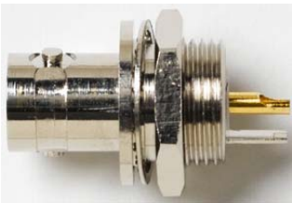
Model 6741 BNC (F) Bulkhead, Isolated ground