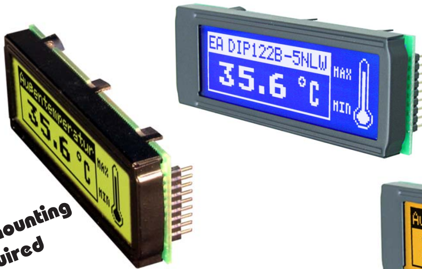
blue-white: EA DIP122B-5NLW Dimension 75 x 27 mm