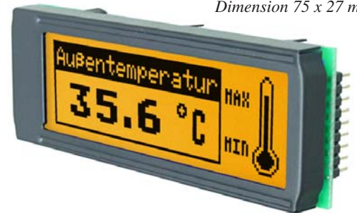
amber: EA DIP122J-5NLA Dimension 75 x 27 mm