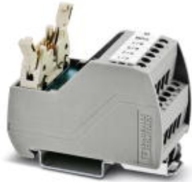
VARIOfACE Professional (VIP) board for the ROC800 controller

Please be informed that the data shown in this PDF Document is generated from our Online Catalog. Please find the complete data in the user's documentation. Our General Terms of Use for Downloads are valid ( http://phoenixcontact.com/download )