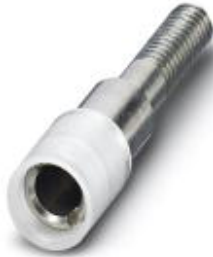
Female test connector, Color: red

Please be informed that the data shown in this PDF Document is generated from our Online Catalog. Please find the complete data in the user's documentation. Our General Terms of Use for Downloads are valid ( http://download.phoenixcontact.com )