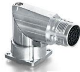
Contact Arrangement mating view

A ED C 047 NN 00 00 051A 000 A G C 047 N 00 00 051A 000