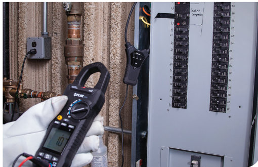
FLIR TA74 used in concert with the FLIR CM83 Clamp Meter