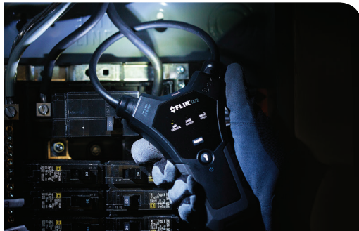
FLIR TA72 with work lights