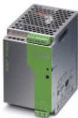
DIN rail power supply unit, primary-switched mode, 1-phase, output: 12 V DC / 10 A

Please be informed that the data shown in this PDF Document is generated from our Online Catalog. Please find the complete data in the user's documentation. Our General Terms of Use for Downloads are valid ( http://phoenixcontact.com/download )