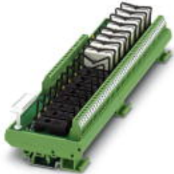
VARIOFACE module, for 16 plug-in miniature relays or miniature optocouplers, with LED, 230 V AC input voltage

Please be informed that the data shown in this PDF Document is generated from our Online Catalog. Please find the complete data in the user's documentation. Our General Terms of Use for Downloads are valid ( http://phoenixcontact.com/download )