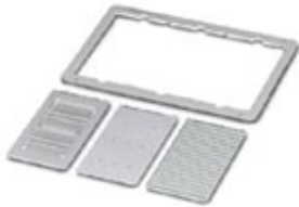
Magazine insert, for CMS-WMU, accepts: 17 SS-ZB strips

Please be informed that the data shown in this PDF Document is generated from our Online Catalog. Please find the complete data in the user's documentation. Our General Terms of Use for Downloads are valid ( http://phoenixcontact.com/download )