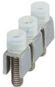
Fixed bridge, Number of positions: 3, Color: silver

Please be informed that the data shown in this PDF Document is generated from our Online Catalog. Please find the complete data in the user's documentation. Our General Terms of Use for Downloads are valid ( http://download.phoenixcontact.com )