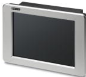
15-in. display shown

Please be informed that the data shown in this PDF Document is generated from our Online Catalog. Please find the complete data in the user's documentation. Our General Terms of Use for Downloads are valid ( http://download.phoenixcontact.com )