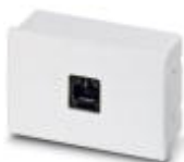
Panel to mount in base unit, RJ-45 connector for remote Operator Panel