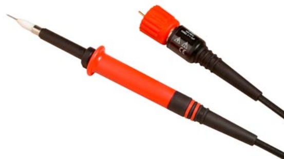
Model 6498 1000V CAT II Passive Oscilloscope Probe