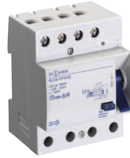
FI 4 a