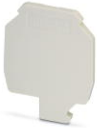
End cover, insulation material: ceramic

Please be informed that the data shown in this PDF Document is generated from our Online Catalog. Please find the complete data in the user's documentation. Our General Terms of Use for Downloads are valid ( http://phoenixcontact.com/download )