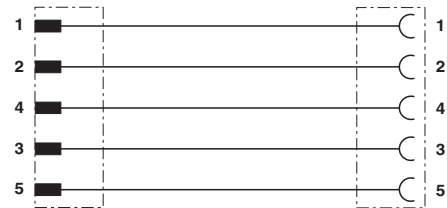
Contact assignment of the 7/8" connector and the 7/8" socket