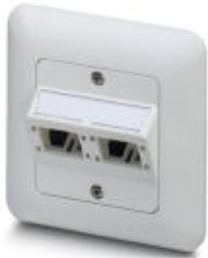
Terminal outlet, flush-type mounting, IP20, two slots for contact inserts with the Freenet system

Please be informed that the data shown in this PDF Document is generated from our Online Catalog. Please find the complete data in the user's documentation. Our General Terms of Use for Downloads are valid ( http://download.phoenixcontact.com )