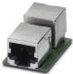
RJ45 socket insert, for the Freenet system, CAT5e, 8-pos., shielded, socket on socket

RJ45 female insert - VS-08-BU-RJ45-5-F/BU - 1652952