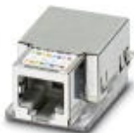
RJ45 socket insert, for the Freenet system, CAT5e, 8-pos., shielded, with cable connection (IDC fast connection), for solid wires AWG 24 ... 22

RJ45 female insert - VS-08-BU-RJ45-5-F/PK - 1652936