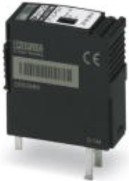
Replacement plug for PLUGTRAB PT-IQ controller for power supply

Please be informed that the data shown in this PDF Document is generated from our Online Catalog. Please find the complete data in the user's documentation. Our General Terms of Use for Downloads are valid ( http://phoenixcontact.com/download )