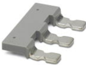
Insertion bridge, 3-pos., fully insulated

Please be informed that the data shown in this PDF Document is generated from our Online Catalog. Please find the complete data in the user's documentation. Our General Terms of Use for Downloads are valid ( http://phoenixcontact.com/download )