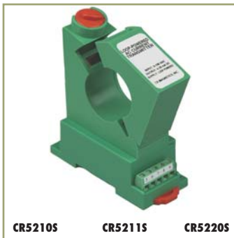
Single Element - 1.2" Window 20 to 300 ADC Input Range

The CR5200 Series, DC Current Transducers are designed to provide a DC signal which is proportional to a DC sensed current. These devices are designed for direct current only, targeting them towards general and daily applications. The ranges 2 to 10 Amp utilize an advanced Magnetic Modulator technology and the ranges 20 amps and above utilize Hall Effect technology.