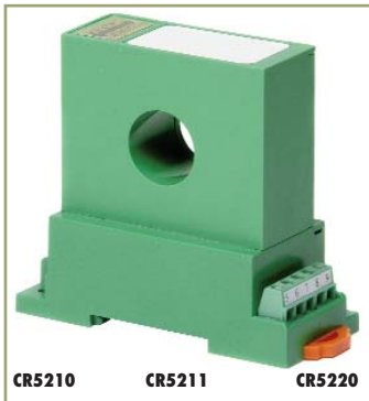
Single Element - .79" Window 2 to 300 ADC Input Range