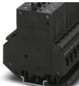
Thermomagnetic circuit breaker, 2-pos., normal blow, 1 N/O contact and 1 N/C contact, with universal foot for mounting on NS 32 or NS 35

Please be informed that the data shown in this PDF Document is generated from our Online Catalog. Please find the complete data in the user's documentation. Our General Terms of Use for Downloads are valid ( http://download.phoenixcontact.com )