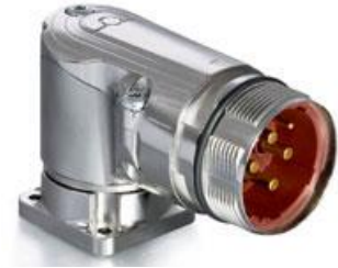
Contact Arrangement mating view

C ED E 271 NN 00 00 0051 000 C G E 271 N 00 00 0051 000