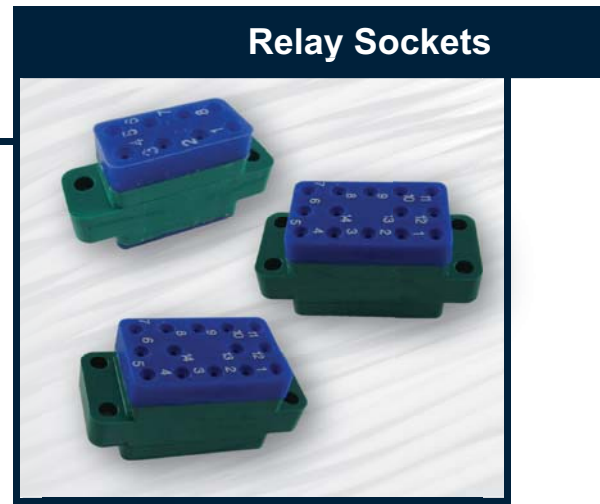
Mates with M39016 & M5757 Relays