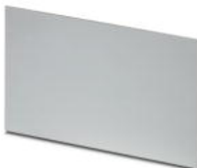
Panel mounting base, Front plate, Color: aluminum color, Width: 101.8 mm, Constructional height: 2 mm

Please be informed that the data shown in this PDF Document is generated from our Online Catalog. Please find the complete data in the user's documentation. Our General Terms of Use for Downloads are valid ( http://phoenixcontact.com/download )