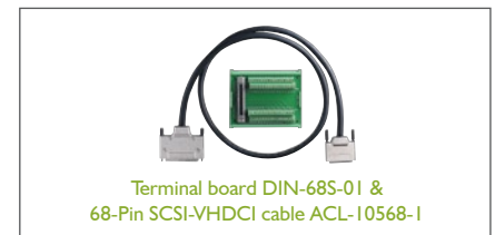
Terminal board DIN-68S-01 & 68-Pin SCSI-VHDCI cable ACL-10568-I