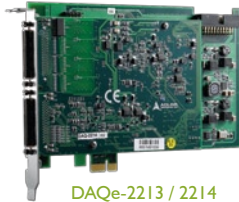
DAQe-2213 / 2214