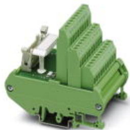
VARIOFACE sensor module, for connecting 8 pnp sensors

Please be informed that the data shown in this PDF Document is generated from our Online Catalog. Please find the complete data in the user's documentation. Our General Terms of Use for Downloads are valid ( http://phoenixcontact.com/download )