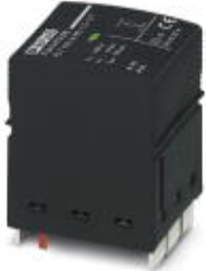
Type 1/Class I/B arrester (lightning arrester) replacement plug for N-PE path.

Please be informed that the data shown in this PDF Document is generated from our Online Catalog. Please find the complete data in the user's documentation. Our General Terms of Use for Downloads are valid ( http://phoenixcontact.com/download )