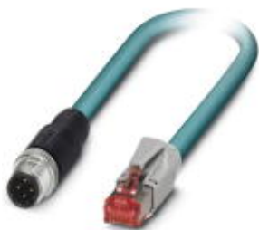
Assembled Ethernet cable, CAT5e, shielded, 2-pair, 26 AWG stranded (7-wire), RAL 5021 (water blue), M12 plug, A-coded to RJ45 plug/IP20, line, length: 3 m

Please be informed that the data shown in this PDF Document is generated from our Online Catalog. Please find the complete data in the user's documentation. Our General Terms of Use for Downloads are valid ( http://phoenixcontact.com/download )