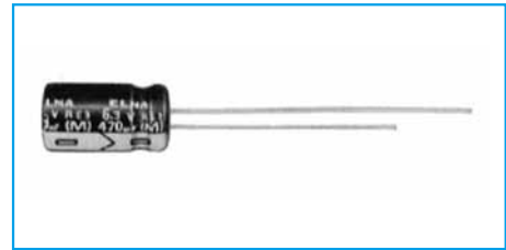
Marking color : White print on a blue sleeve