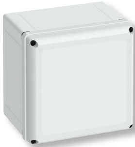
Cat No. 700-733 GEOS-L 3030-22-o with grey cover