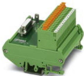
VARIOFACE module, with 15-pos. D-SUB socket strip and screw connection with knife disconnection, for mounting on NS 35/7,5 or NS 32

Please be informed that the data shown in this PDF Document is generated from our Online Catalog. Please find the complete data in the user's documentation. Our General Terms of Use for Downloads are valid ( http://phoenixcontact.com/download )