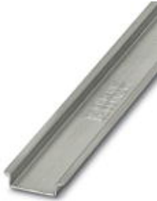
DIN rail, material: steel, unperforated, height: 7.5 mm, width: 35 mm, length: 1 m

Please be informed that the data shown in this PDF Document is generated from our Online Catalog. Please find the complete data in the user's documentation. Our General Terms of Use for Downloads are valid ( http://phoenixcontact.com/download )