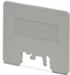
Separating plate, Length: 80 mm, Width: 2 mm, Height: 70 mm, Color: gray

Please be informed that the data shown in this PDF Document is generated from our Online Catalog. Please find the complete data in the user's documentation. Our General Terms of Use for Downloads are valid ( http://download.phoenixcontact.com )