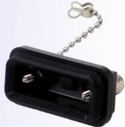
Connector Cap (DBSCAP)