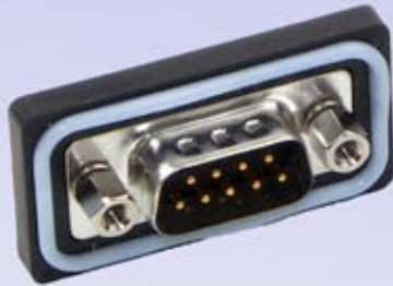
Panel Mount (DCPDB09MSC1)