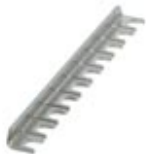
Fixed bridge, Number of positions: 10, Color: silver

Please be informed that the data shown in this PDF Document is generated from our Online Catalog. Please find the complete data in the user's documentation. Our General Terms of Use for Downloads are valid ( http://download.phoenixcontact.com )