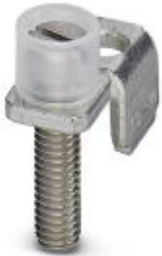
Chain bridge, Number of positions: 1, Color: silver

Please be informed that the data shown in this PDF Document is generated from our Online Catalog. Please find the complete data in the user's documentation. Our General Terms of Use for Downloads are valid ( http://phoenixcontact.com/download )