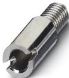
Female test connector, Color: silver

Please be informed that the data shown in this PDF Document is generated from our Online Catalog. Please find the complete data in the user's documentation. Our General Terms of Use for Downloads are valid ( http://download.phoenixcontact.com )