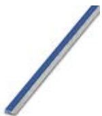
Continuous plug-in bridge, Length: 500 mm, Color: blue

Continuous plug-in bridge - FBST 500-PLC BU - 2966692