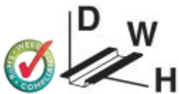
Figure shows PLC-BSC-120UC/21-21/SO46 version

14 mm PLC basic terminal block with screw connection, without relay or solid-state relay, for mounting on DIN rail NS 35/7,5, 2 PDTs, input voltage 24 V AC/DC