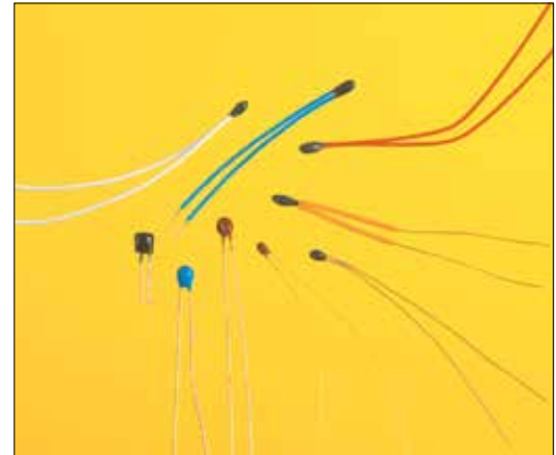
Coated Chip Style