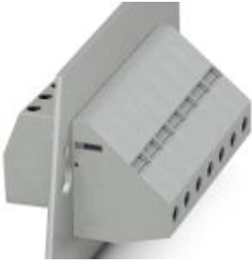
The illustration shows version HDFKV 25

Please be informed that the data shown in this PDF Document is generated from our Online Catalog. Please find the complete data in the user's documentation. Our General Terms of Use for Downloads are valid ( http://download.phoenixcontact.com )