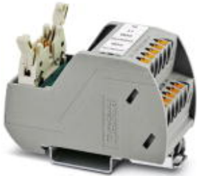
VARIOfACE Professional (VIP) board for the ROC800 controller

Please be informed that the data shown in this PDF Document is generated from our Online Catalog. Please find the complete data in the user's documentation. Our General Terms of Use for Downloads are valid ( http://phoenixcontact.com/download )