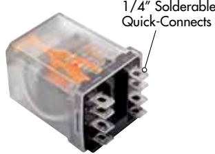
Plain Cover Option C