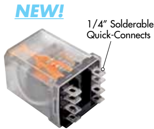
Plain Cover Option C